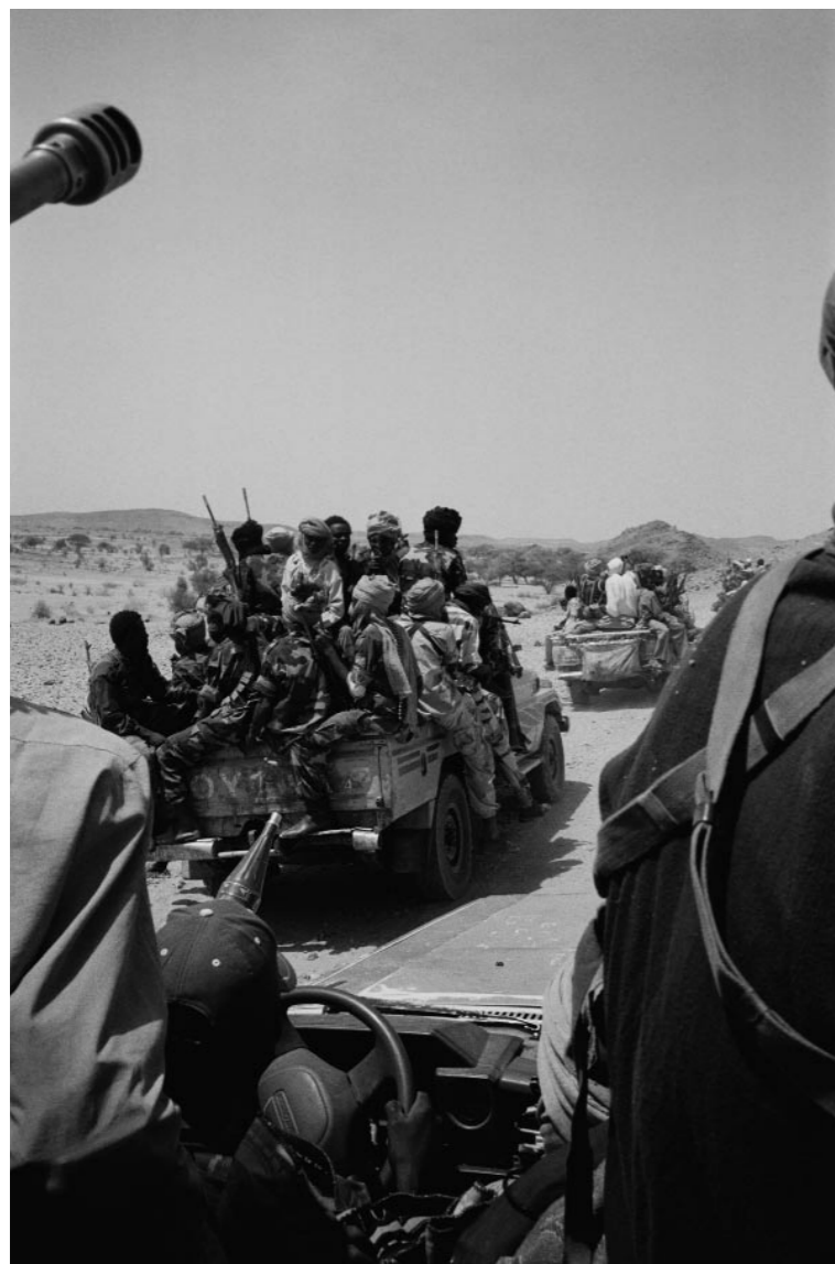
Rebelles de l'Armée de libération du Soudan (SLA) à Faraway, dans le Nord Darfour.

LES GUERRES DU SOUDAN SONT ATTISÉES PAR LES RICHESSES DU PAYS EN HYDROCARBURES. LA GÉOPOLITIQUE S'EN MÊLE. LA CHINE A PRIS LE RELAIS DES COMPAGNIES PÉTROLIÈRES AMÉRICAINES ET ENTRAÎNE, AU SEIN DE L'ONU, LES MESURES QUI POURRAIENT AMENER KHARTOUM À ENRAYER LA VIOLENCE AU DARFOUR. ANALYSE.